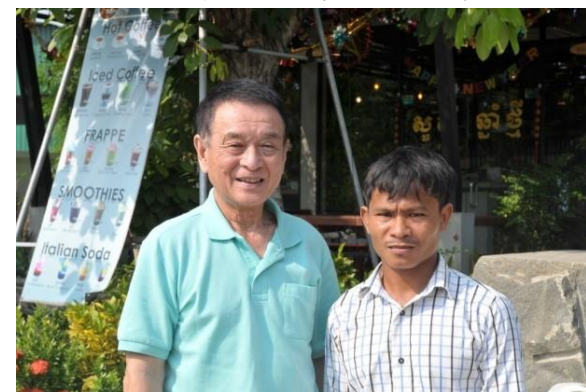
ポットロン小学校ナウ・ナーン校長と私

◇2018年度のSSFC支援・協力校はポットロン小学校とスレイ・ビボケイ中学校 両校ともに校長に指導力があり、先生も若く意欲がある学校です