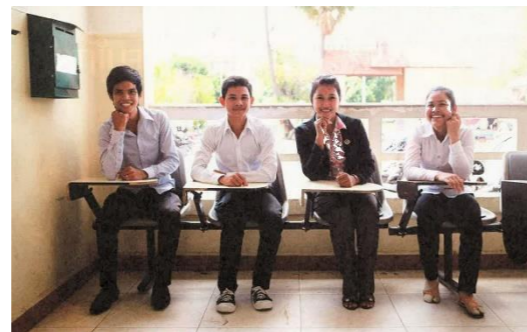
プノンペンの大学で勉強する4人の若者