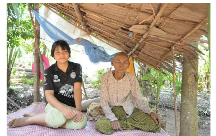
近くに住むお祖母さんと